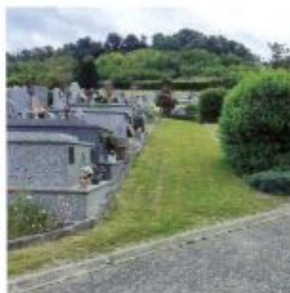
Entretien des cimetières par le service des Espaces Verts