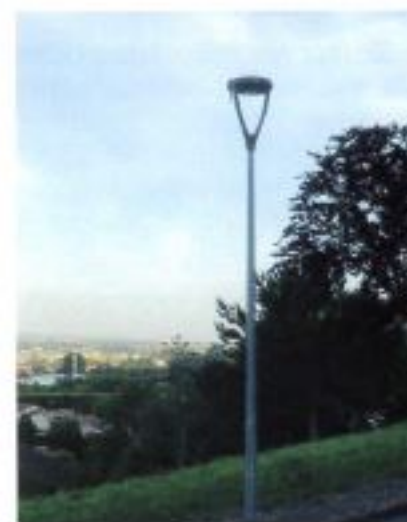
Remplacement des luminaires rue de l'Ermitage par un éclairage LED.