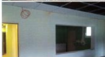
Réfection de la salle Jean-Gérard Debats (agrandissement des vestiaires des filles et des locaux pour le personnel d'entretien)