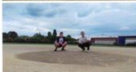
Réhabilitation de l'infield* (Terrain 1) du Baseball. Travaux réalisés par Turflac (Montant : 20 124€ TTC) *champ intérieur de l'aire de jeu.