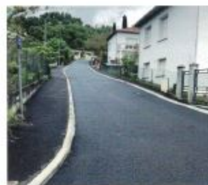
Réfection de la chaussée enrobée, Chemin du cimetière (bourg).