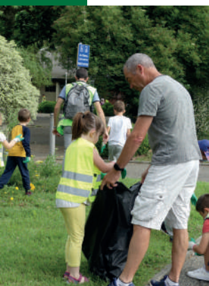
Elèves, élus et parents se sont mobilisés pour cette opération.

Au vu du succès de la première édition (en 2022), lancée par le Conseil Départemental du Lot-et-Garonne, l'opération « 47 jours pour nettoyer la ville et la nature » s'est renouvelée cette année du 13 mai au 28 juin, en partenariat avec