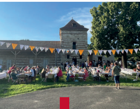
Ambiance Guinguette à Tortis