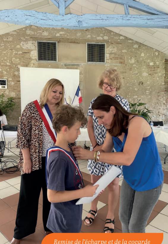
Remise de l'écharpe et de la cocarde

Le Conseil Municipal des Jeunes se compose comme suit (par ordre alphabétique) :