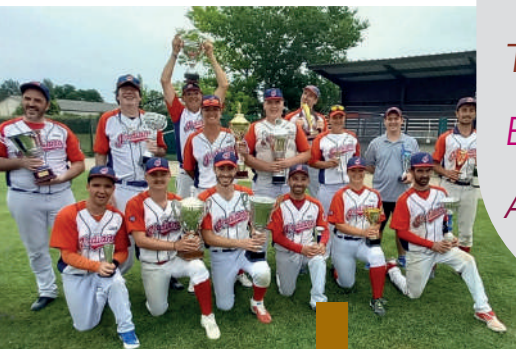
Félicitations aux Indiens !