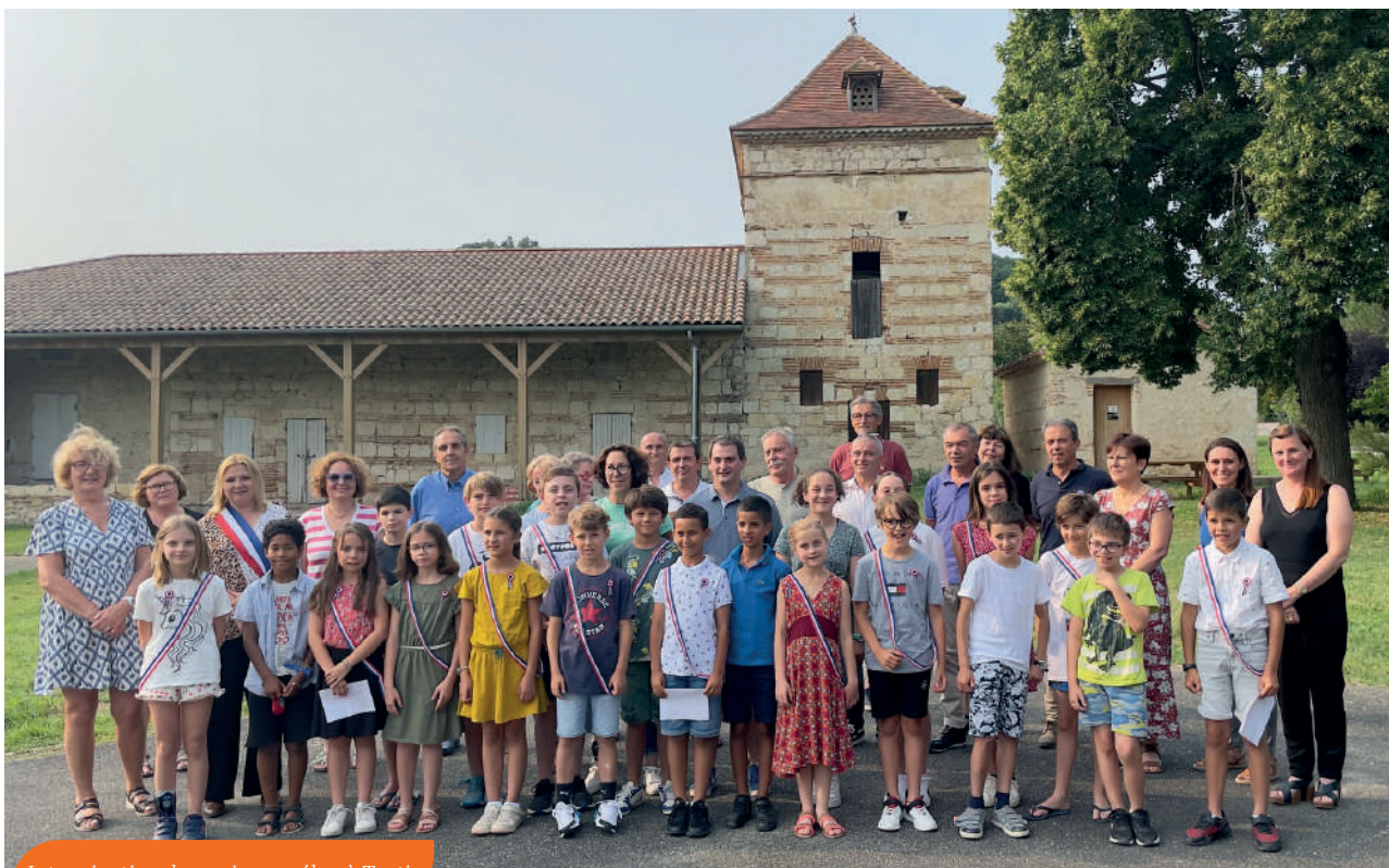
Intronisation de nos jeunes élus à Tortis