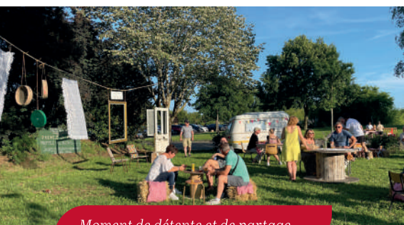
Moment de détente et de partage ...

rencontre ( qui a confectionné les guirlandes en tissus ) ont plongé le public dans cette ambiance nostalgique mais néanmoins festive des guinguettes d'antan. Bottes de pailles, serviettes vichy, dentelles, jeux en bois, fanions, guirlandes lumineuses, caravane vintage, ... tous les ingrédients étaient réunis pour une soirée à l'esprit guinguette :