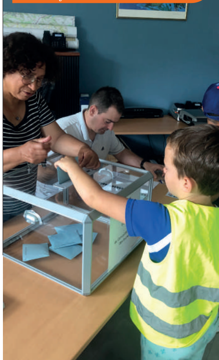
Jour de vote en mairie : les enfants suivent les instructions

Il s'en suivra des réunions de travail où les jeunes établiront des choix en fonction des contraintes, des priorités... comme les grands ! Une journée cohésion de groupe a permis de renforcer les liens et de s'initier aux gestes qui sauvent. Un premier pas vers l'engagement au service des autres.