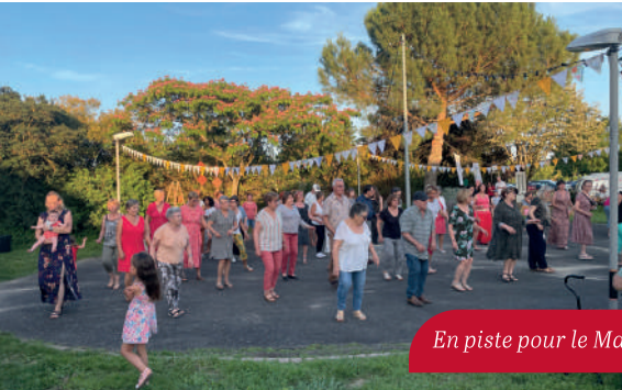
En piste pour le Madison !

rencontre ( qui a confectionné les guirlandes en tissus ) ont plongé le public dans cette ambiance nostalgique mais néanmoins festive des guinguettes d'antan. Bottes de pailles, serviettes vichy, dentelles, jeux en bois, fanions, guirlandes lumineuses, caravane vintage, ... tous les ingrédients étaient réunis pour une soirée à l'esprit guinguette :