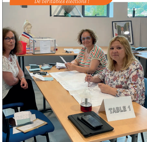
Installation des tables de dépouillements. De véritables élections !