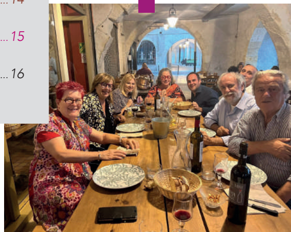
Comité de jumelage Bon-Encontre Reggio ( Italie)

Distribution du journal « Le Mag' » de Bon-Encontre. Vous avez été nombreux à ne pas recevoir le bulletin municipal d'avril dans vos boîtes aux lettres. Veillez nous en excuser. Nous avons rencontré un problème avec notre distributeur, la société Milee (anciennement ADREXO), elle n'a pas rempli ses obligations.