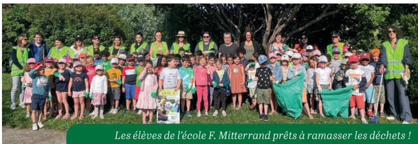
Les élèves de l'école F. Mitterrand prêts à ramasser les déchets !