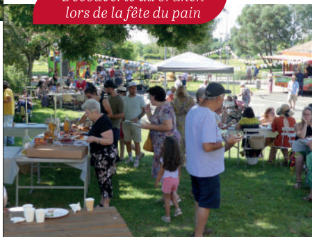
Les pavés, baguettes et pizzas cuits au four par nos boulangers ont été très appréciés