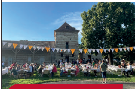
Un cadre idéal pour cette 1 ère édition

populaire et conviviale ! Sans oublier l'orchestre mené par Cédric Bergounioux qui a enchaîné les titres des plus anciens aux plus récents pour le plus grand plaisir de nos aînés et nos plus jeunes. Quant à nos tout-petits, ils ont pu découvrir les jeux en bois.