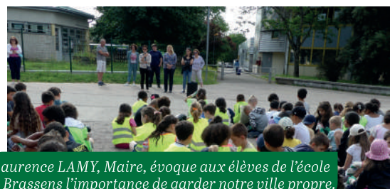
Laurence LAMY, Maire, évoque aux élèves de l'école G. Brassens l'importance de garder notre ville propre.

Equipés de chasubles, de gants et sacs poubelles, ils étaient décidés à « faire le grand nettoyage » sur la commune : aux abords des écoles, sur la place du marché, au