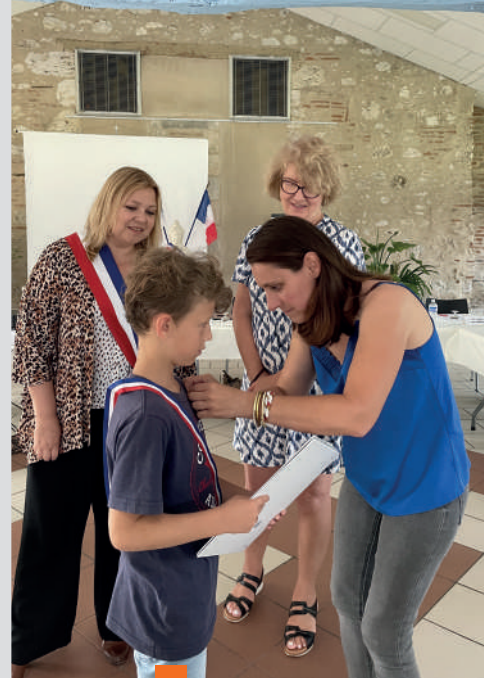
Conseil Municipal des Jeunes