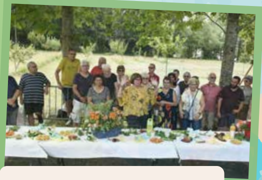
Un moment convivial, ponctué d'animations, d'ateliers et d'une pause musicale (les Amis de S te -Radegonde)