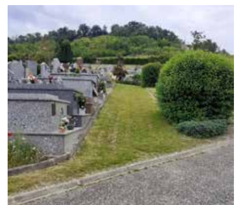
Entretien des cimetières par le service des espaces Verts.