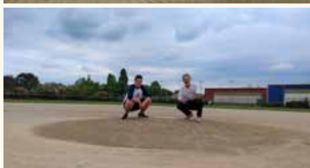
Réhabilitation de l'Infield* (Terrain 1) du Baseball. Travaux réalisés par Turflac (Montant : 20 124€ TTC) *champ intérieur de l'aire de jeu.