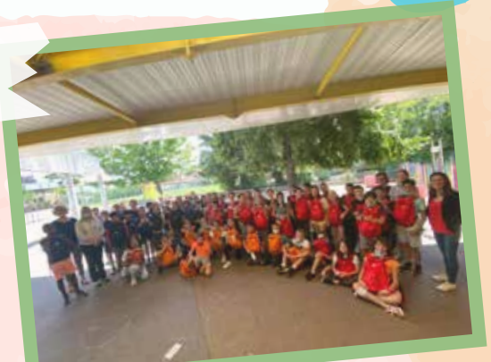
Remise des prix pour les CM2 des écoles G. Brassens et S t Ferréol. Nous leurs souhaitons une bonne rentrée au collège, plus douce et plus sereine que cette année.