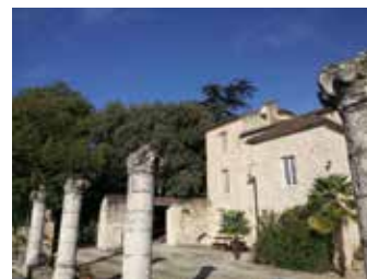
* Obligation Réelle Environnementale

Le Conservatoire d'espaces naturels Nouvelle Aquitaine a décerné la 1 ère ORE* en Lot-et-Garonne aux propriétaires du Prieuré, leur permettant de mettre en place une protection environnementale, de favoriser la biodiversité et les fonctions écologiques sur leur terrain. Félicitations à eux !