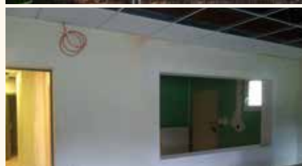
Réfection de la salle Jean-Gérard Debats (agrandissement des vestiaires des filles et des locaux pour le personnel d'entretien)