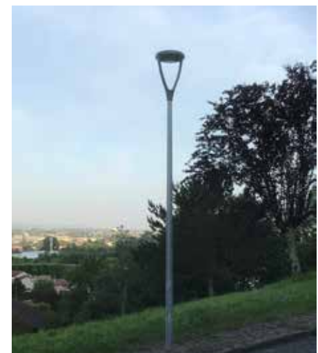
Remplacement des luminaires rue de l'Ermitage par un éclairage LED.