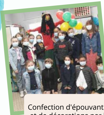
Confection d'épouvantails et de décorations par les enfants de nos écoles.