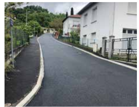
Réfection de la chaussée en enrobé, Chemin du cimetière (bourg).