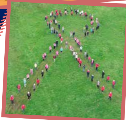
Ce "noeud solidaire" illustrera les cartes de vœux de Bon-Encontre 2021.