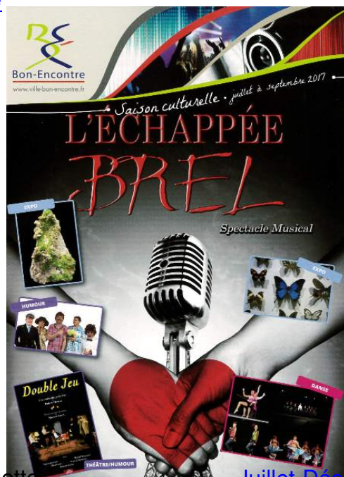
Télécharger la plaquette