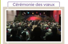
Cérémonie des vœux Cette année, les vœux du maire et du conseil municipal ont eu lieu au centre J. Privat. Emotions lors de l'animation musicale de la grande Salle JOUJBA, accompagnée de la chorale GLORYSPEL.

Le Journal des Bon-Encontreais Journal d'information municipale février 2010