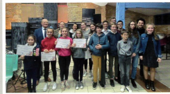
Mise à l'honneur des jeunes sportifs méritants (association Danse'n Coet club de Baseball) qui se sont distingués. Sur la photo : le Maire entouré des élèves de l'école de Musique qui ont animé la soirée et de l'association Danse'n Co.