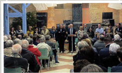
La nouvelle salle de Tortis a accueilli les vœux à la population du Maire et du Conseil Municipal.