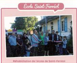
Réhabilitation de l'école de Saint-Ferréol