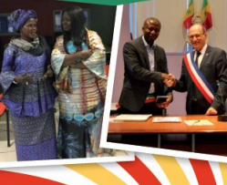
Retour sur le mois de mai aux couleurs Carabanaises