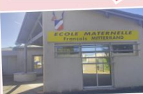
Ouverture d'une classe - lire l'article page 3